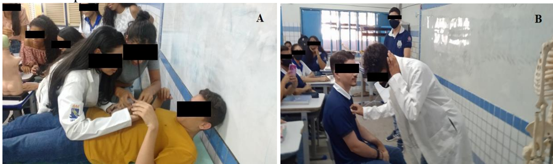
Figura 4 - Estudantes simulando por meio do RPG um atendimento médico. A – simulação de palpação onde participam paciente, médica e enfermeira; B – simulação de ausculta médica em paciente.