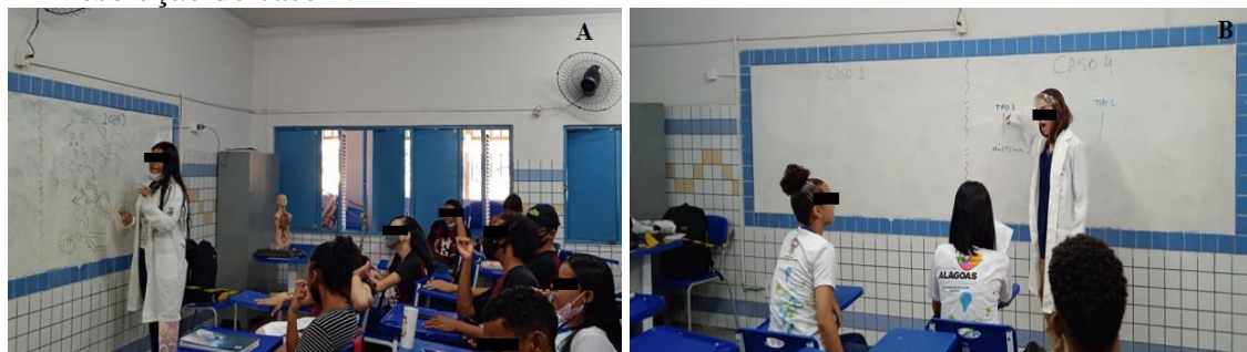
Figura 5 - Estudantes expõem a resolução para os casos em estudo. A – resolução do caso 1; B – resolução do caso 4.