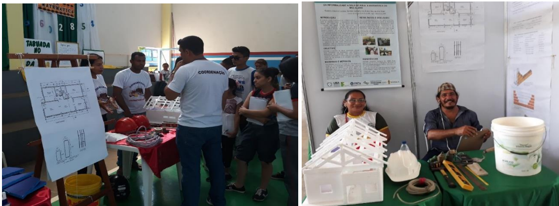
FIGURA 02 e 03: 1ª dupla de alunos participando da seletiva da I Feira de Matemática e 2ª dupla de alunos participando da I Feira Amazonense de Matemática

A atividade desenvolvida em sala de aula e compartilhada em eventos municipal e estadual superou as expectativas dos estudantes que representaram a escola, uma vez que os visitantes tiveram muito interesse em saber que matemática é utilizada para orçar os materiais e seus preços, assim como a mão de obra e o tempo gasto para a construção e execução de calçadas, muros, reboco de parede e assentamento de pisos cerâmicos em residências, fato que pode ser visto na figura 02 a seguir.