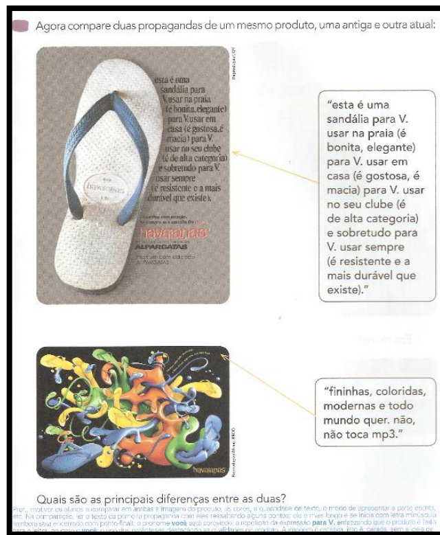
Figura 4 – Atividade sobre formas distintas de anunciar um mesmo produto