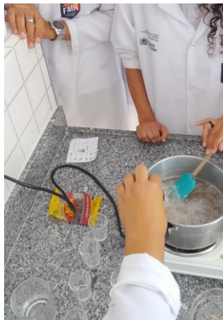
FIGURA 2. Atividade experimental: Produção de velas aromatizantes.

Foi avaliado a participação ativa dos estudantes na atividade experimental, conforme a figura 2. O produto da experimentação, conforme a figura 3, com a produção da vela aromatizante a base da parafina de óleo de coco e cravo da índia, sua queima não libera gases poluentes, pois não tem como subproduto a parafina a base de petróleo.