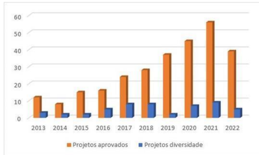
Gráfico I - Projetos aprovados pelo CEP-IFBA entre 2013 e 2022.