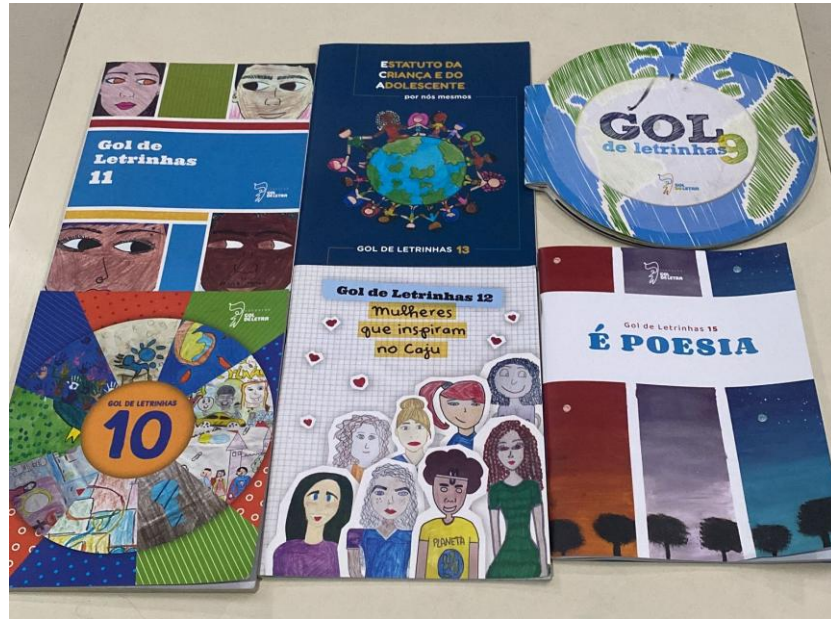
Imagem 2: Seis últimas edições do Gol de Letrinhas

O Gol de Letrinhas chega esse ano a sua 16ª edição. Construída a partir de “caminhares” coletivos, por meio da dialogicidade, é um dos principais resultados dos processos de apropriações da linguagem escrita.