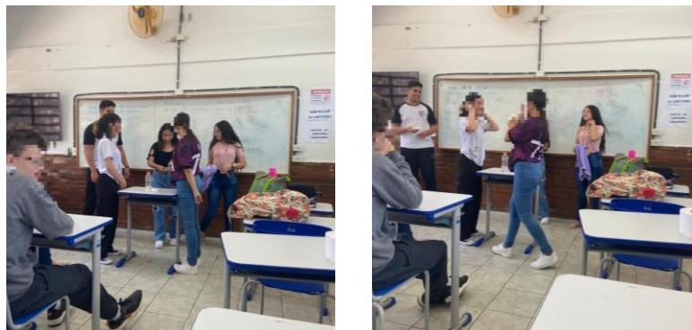
Figura 7 - Etapa 5: Avaliação - aplicação do jogo “torta na cara”.

A maioria dos estudantes responderam corretamente aos questionamentos. Mas, também houveram duplas em que nenhum dos estudantes responderam, como também tiveram aqueles que responderam equivocadamente, nestas situações, explicamos os conceitos como uma forma de revisão.