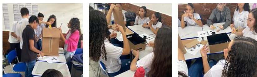
Figura 4 - Etapa 2: Apresentação do Material Experimental para Investigação – Construção do Desidratador Solar

A quarta e quinta aula (figura 4) ficaram reservadas para a construção do Desidratador Solar - etapa 2 da AEI (apresentação do material experimental para investigação). A turma foi dividida em duas equipes, construindo, portanto, dois Desidratadores. O que ressaltamos dessa aula foi o envolvimento ativos dos estudantes que demonstraram bastante animação e afinco na montagem do aparato, dividindo as atividades: enquanto uns liam o manual de construção, outros iam fazendo os cortes e ajustes necessários na caixa, outros cortavam a parte de suporte para os alimentos e outros ficaram na função da pintura da caixa.