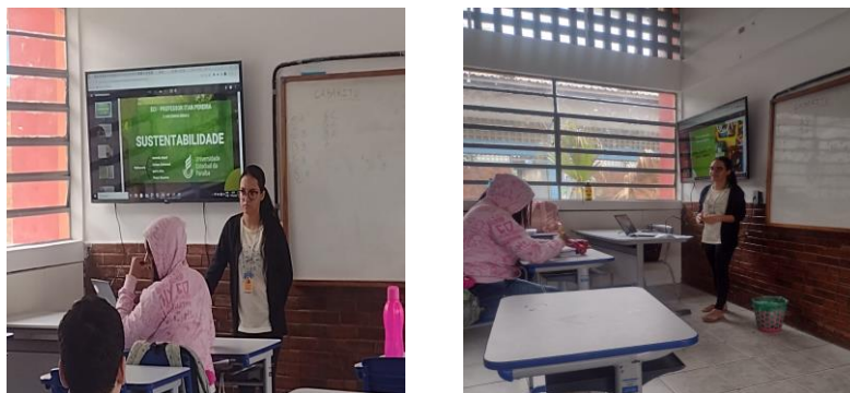
Figura 3 - Aula informativa sobre a construção do Desidratador.

seriam necessários e quais deles poderiam ser usados como forma de reaproveitamento (ex.: papelão, vidro, madeira, metal).