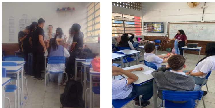
Figura 5 - Etapa 3: Sistematização Coletiva do Conhecimento.

Na sexta aula, primeiro momento (figura 5), realizamos uma sistematização coletiva do conhecimento (etapa 3), onde os estudantes foram indagados sobre a explicação do funcionamento do Desidratador. Perguntávamos, por exemplo, o "como" e o "por quê" do uso do vidro e do motivo pelo qual a caixa de papelão deveria ser pintada de preto. Algumas respostas dadas por eles foram: "porque o vidro absorve o calor", "porque o preto também absorve o calor". Vale ressaltar que o Desidratador não foi imediatamente posto em funcionamento, pois o clima estava chuvoso, e mesmo que o fosse, existe um tempo necessário para que a desidratação dos rejeitos orgânicos aconteça (um a dois dias). Assim, para que os estudantes pudessem visualizar o que aconteceria com os alimentos, foi mostrado imagens do resultado de rejeitos depois da desidratação e indagado também sobre como aquilo acontece e porquê.