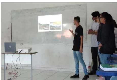
Figura 2: Aula teórica sobre atmosfera terrestre sendo ministrada pelos pibidianos

A aula teórica do conteúdo trabalhado foi executada durante o primeiro horário da disciplina de ciências conforme mostra a Figura 2. Foi optado por produzir uma apresentação no Power Point onde os subtemas composição do ar, efeito estufa, camada de ozônio e uma breve introdução sobre o gás hidrogênio e sua importância foram explicados. A aula decorreu de maneira tranquila, os alunos estavam atentos a explicação e participativos quando lhes era perguntado algo.