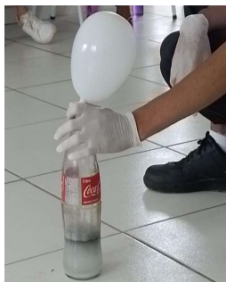
Figura 3: Experimento de produção do gás hidrogênio durante a execução onde o gás já estava sendo produzido durante a reação

Antes de iniciarmos a prática por segurança organizamos os alunos em uma meia lua para não ficarem perto da soda cáustica e nem do fogo. O experimento foi iniciado adicionando com o auxílio de um funil três colheres de sopa de soda cáustica na garrafa de vidro, logo foi adicionado em torno de 60 ml de água em seguida de 10 bolinhas de papel alumínio em seguida a bexiga foi colocada no gargalo da garrafa. A reação foi instantânea e logo a bexiga começou a encher de gás hidrogênio (Figura 3).