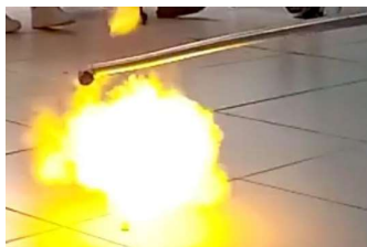
Figura 4: Explosão provocada pelo contato da bexiga com a chama da vela

Após a finalização da primeira parte do experimento foram entregues bexigas aos alunos e assim comparamos o gás hidrogênio presente na bexiga usada e o gás carbônico presente nas outras, onde uma flutuava e a outra caía mais rápido. Na segunda parte do experimento utilizamos um cano onde prendemos o balão e uma vela fixa no chão que foi acesa para entrar em contato com a bexiga e assim demonstrar a presença do gás hidrogênio que ao entrar em contato com a chama causou uma pequena e rápida explosão como está sendo mostrada na Figura 4.