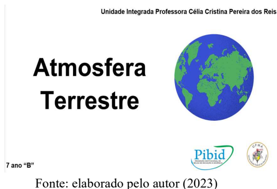
Figura 1: Capa do slide produzido pelos pibidianos e utilizado durante a aula expositiva dialogada