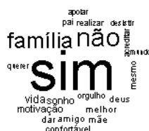
Figura 3: Nuvem de palavras

A nuvem de palavras (figura 3) complementou a análise, demonstrando pela frequência das palavras: família, vida, sonho, motivação, mãe e orgulho, o que de fato motiva o sonho dos entrevistados.