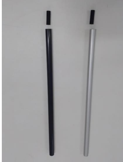
Figura 02 – Tubos de PVC e Alumínio