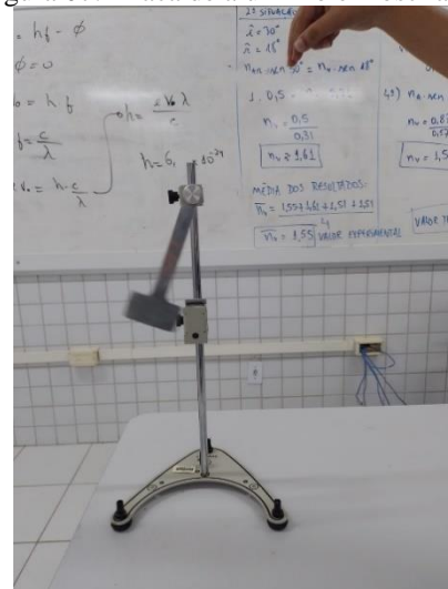
Figura 07: Placa de alumínio em oscilação