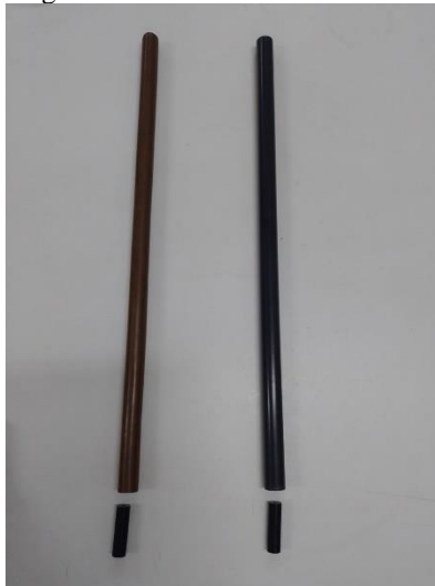
Figura 03 – Tubos de Cobre e PVC

Na Figura 03, temos o mesmo processo, mas agora utilizando os tubos de cobre e PVC. Observamos que no tubo de cobre, os ímãs tiveram um deslocamento mais lento em comparação com o tubo de PVC. Isso ocorre devido ao cobre ser um material condutor, enquanto o PVC não, ocasionando assim um freio magnético no tubo de cobre.