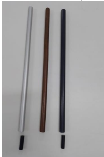
Figura 01 – Tubos de Alumínio, Cobre e PVC

Abaixo, apresentamos o experimento sobre o Freio Magnético em Tubos (PVC, Alumínio e Cobre). Na Figura 01 podemos observar os três tubos e dois ímãs que vamos utilizar para a produção do experimento.