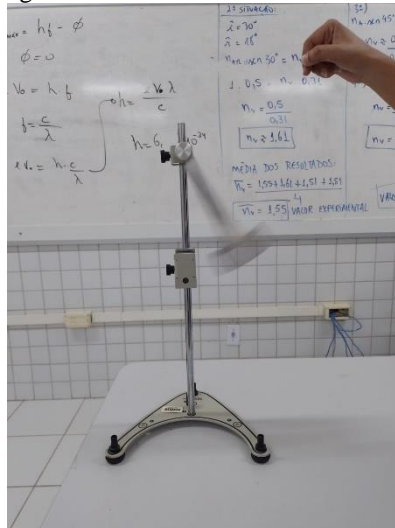
Figura 08: Placa de alumínio denteada

rápido em comparação com a outra plaquinha que era totalmente preenchida. Isso acontece devido a esta plaquinha ser denteada, fazendo com que não haja uma variação tão expressiva no fluxo magnético, não ocorra a produção de corrente elétrica e também não gere uma interação de campos magnéticos. Sendo assim, não há um freio magnético da mesma potência que ocorre com a placa totalmente preenchida.