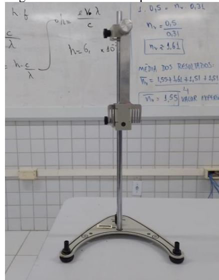
Figura 05: Pêndulo com placa denteada