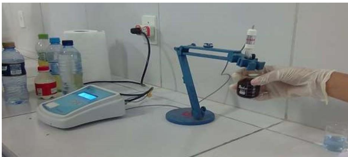
Figura 1 - Phmetro utilizado.

Ao longo da prática foram realizadas discussões sobre os valores obtidos no equipamento e lógica bioquímica de cada amostra analisada.