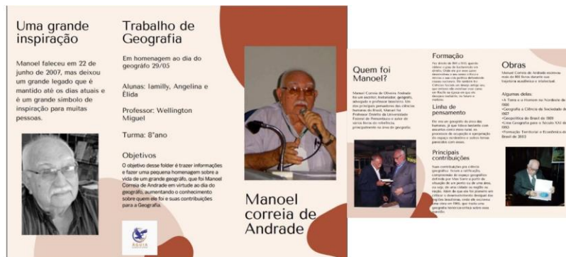
Figura 5: folder dia do Geógrafo