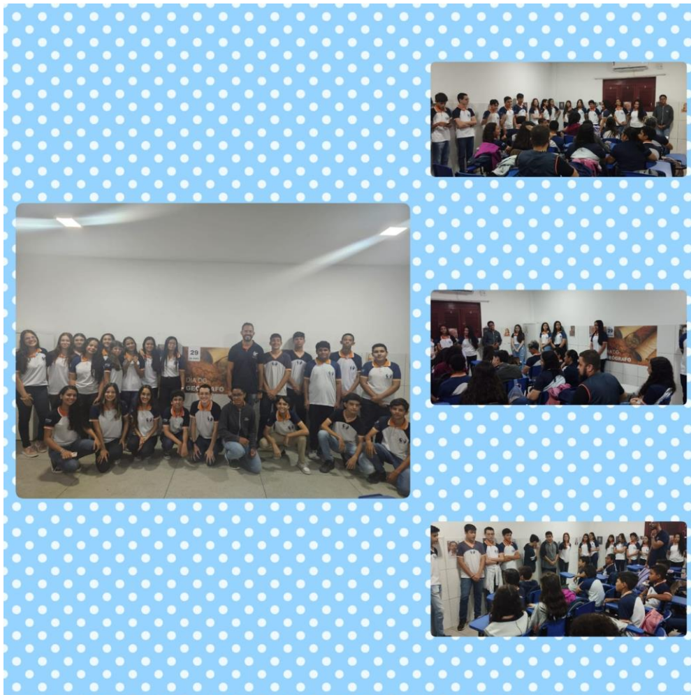
Figura 3: Atividade do dia do Geógrafo

Essa atividade de socialização do conhecimento teórico adquirido na construção de cada um dos podcast, proporcionou um espaço em que todos compartilharam através da prática todo aprendizado adquirido, responderam com segurança os questionamentos e curiosidades dos colegas sobre o assunto. Diante do exposto é de uma educação como essas que necessitamos a qual o educando tenha vez e voz de expressar os seus pensamentos e opiniões referente as pesquisas que realiza e os saberes adquiridos e dessa forma possa ter um amplo conhecimento seguindo o caminho de geografia crítica que vai contra a geografia tradicional que se baseava apenas em observações e no memorável, a corrente do pensamento geográfico crítica defende a ideia de que os alunos são sujeitos críticos e reflexivos capazes de elencar as contradições existentes no espaço e como esse vem sendo transformado com o processo de globalização e a era digital.