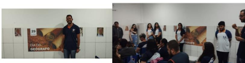
Figura 2: Exposição fotográfica na sala de aula