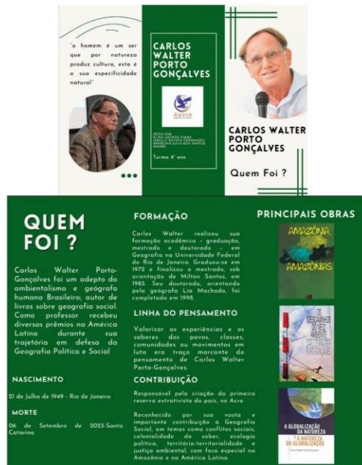
Figura 4: folder dia do Geógrafo

No que compete a confecção dos folders de forma geral os educandos elaboraram no Canva, conforme os tópicos do roteiro do podcast eles tiveram o cuidado de seguir tudo que estava estabelecido nas normas exigidas pelo docente, porém transmitiram nos textos e imagens inseridos nesse gênero textual uma linguagem simples, mas que não afetou de forma brusca o conhecimento científico o qual é valorizado tanto no texto quanto no discurso de cada um educando fazendo uma interligação das imagens com o cotidiano dos educandos e o discurso de cada um dos geógrafos e a sua linha de pensamento conforme as (figuras 4, 5, 6 e 7).