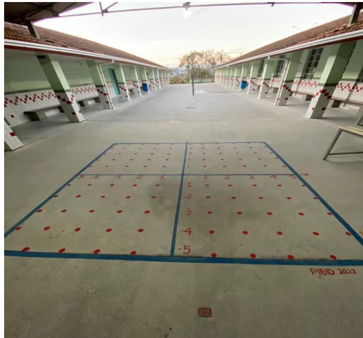
Figura 1 - Plano cartesiano em escala real

Em seguida, foram planejadas duas atividades práticas para que os alunos pudessem aplicar/praticar os conceitos revisados no bingo. A primeira atividade, tinha como finalidade que os alunos realizassem multiplicações de figuras geométricas no plano cartesiano utilizando o geoplano 4 , ferramenta importante para o ensino e aprendizagem da matemática. A terceira e última etapa da oficina, consistiu em uma atividade cujo objetivo era utilizar o plano cartesiano em escala real, produzido pelos bolsistas do PIBID no pátio da escola.