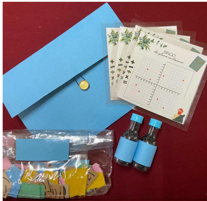
Figura 2 - Materiais utilizados no bingo do plano cartesiano

Inicialmente, foi distribuída uma cartela de bingo e alguns feijões para marcar as coordenadas sorteadas a cada aluno. Os bolsistas sorteavam as coordenadas, escrevendo-as no quadro e ajudando os alunos que tinham mais dificuldade a localizá-las na cartela do bingo do plano cartesiano. Devido ao tempo limitado, o aluno que preencheu mais coordenadas na cartela ganhou a partida.