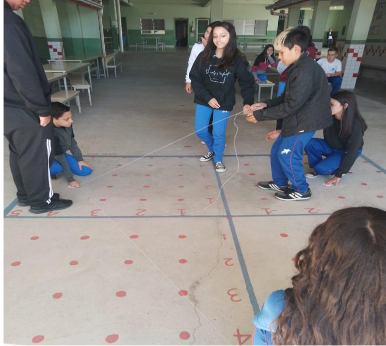
Figura 4 - Caminhando no plano cartesiano

seria formada. Em seguida, os estudantes precisavam transcrever a figura geométrica formada no plano em escala real para o plano disponibilizado em uma folha A4 pelos bolsistas.