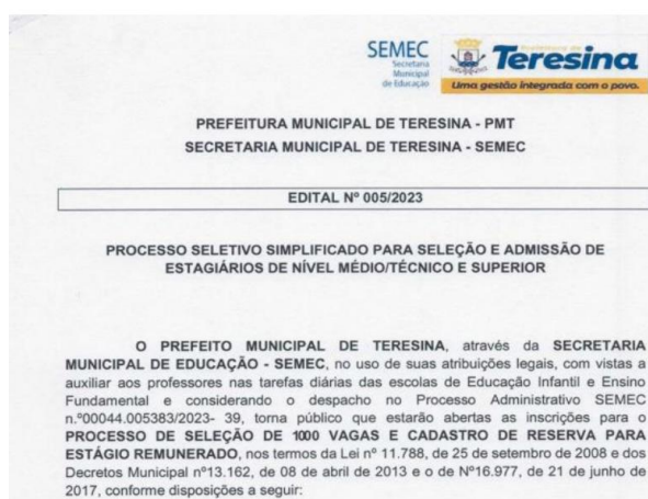
Figura 3: Print tela: Edital de Seleção e admissão de profissionais para atuar em escolas da rede municipal de Teresina (PI).

Pelo edital em análise, identifica-se que os profissionais que atuam na função de acompanhantes são todos estagiários, podendo ter sua contratação temporária pelo prazo de um ano com prorrogação de igual período.