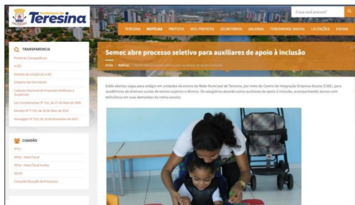
Figura 1: Print Tela – Anúncio Semec destacando abertura de seleção para Auxiliares de Apoio à Inclusão.