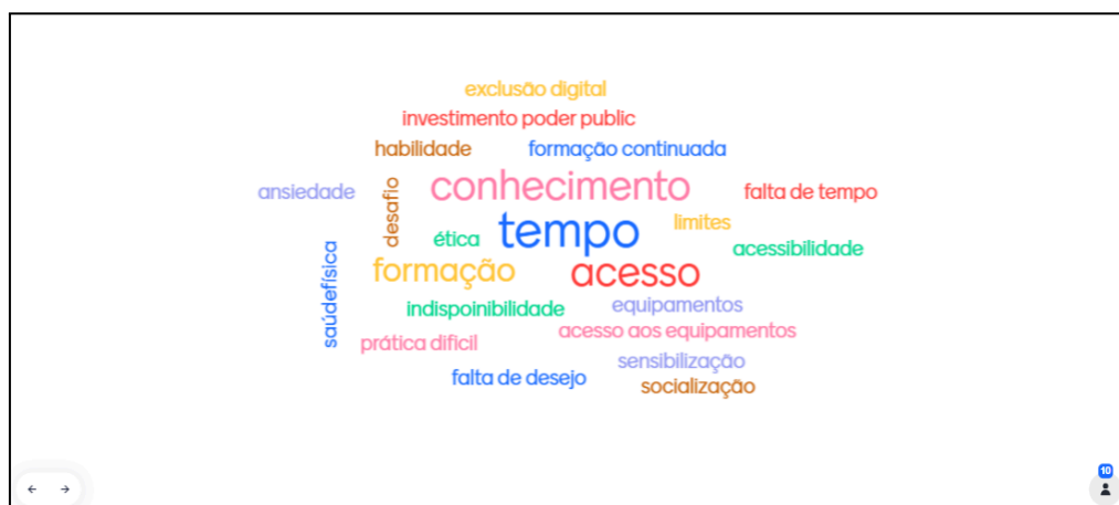
Figura 1 - Dilemas dos professores sobre a utilização das tecnologias digitais na sala de aula

Participaram da roda de conversa 18 (dezoito) professores da escola e responderam ao questionário 9 (nove) professores do turno matutino do 1º ao 5º ano do Ensino Fundamental, sendo todos licenciados em Pedagogia, dos quais 8 (oito) possuem especialização e 1 (um) mestrado. Ir à escola, em um movimento necessário as pesquisas com os cotidianos, procurando sentir os seus sons, cheiros, gestos e imagens, como nos diz Andrade, Caldas e Alves (2019), nos possibilitou a constatação de conhecimentossignificações expressos em narrativas pelos professores, praticantespensantes , ao falarem sobre o cotidiano da docência em contexto de cibercultura. Inicialmente, em uma nuvem de palavras os professores expressaram seus dilemas sobre a utilização das tecnologias digitais em sala de aula. Para eles, fazem parte dos seus dilemas, os sentidos apresentados nas palavras da Figura 1.