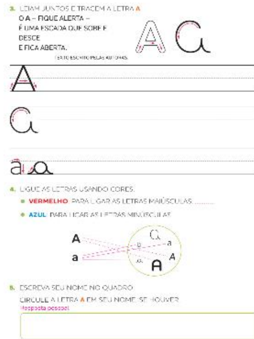
Figura 3: Ápis Mais: Língua Portuguesa, p. 36.

Na figura 3, as autoras do LD, incentivam os estudantes a refletir sobre a sua produção escrita, a proposta é a escrita da letra A, em diferentes tamanhos e formatos, podemos observar que as setas orientam melhor os estudantes para a correta grafia das letras, observando o sentido da escrita da direita para a esquerda. Em seguida, é proposta uma associação com as letras no formato maiúsculo e minúsculo. A atividade termina com a proposta de escrita do nome próprio do aluno, e reconhecer a letra A no nome escrito.