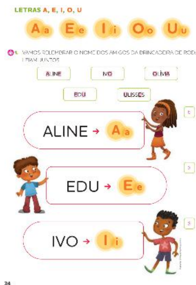
Figura 2: Ápis Mais: Língua Portuguesa, p. 34.

As autoras do LD propõem trabalhar nessa atividade a representação escrita do elemento sonoro, a quantidade de letras de cada palavra e também compreender diferenças entre o tamanho das palavras, conforme as habilidades descritas na BNCC: EF01LP04 (Distinguir as letras do alfabeto de outros sinais gráficos), EF01LP05 (Reconhecer o sistema de escrita alfabética como representação dos sons da fala), EF01LP07 (Identificar fonemas e sua representação por letras), EF01LP08 (Relacionar elementos sonoros (sílabas, fonemas, partes de palavras) com sua representação escrita).