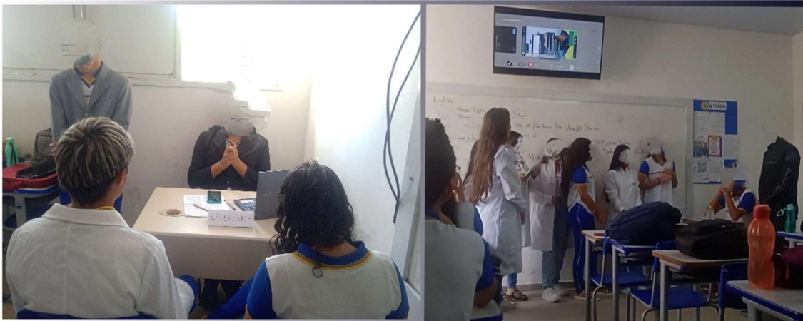
Figura 01: Apresentação dos trabalhos teatrais de alguns grupos