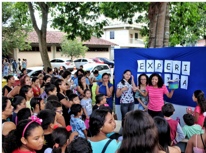
Figura 1: Aula inaugural de 2019.

Como uma mostra científica, com a visitação livre em stands (com experimentações, gincanas científicas e produções artísticas, jogos, brincadeiras, desafios lógicos, apresentações e outras), porém, como destaca Nunes (2016), mantém eixo central “as Ciências e Matemáticas”, além da participação ativa do aluno e dos pais, bem como as primeiras inserções a investigação como prática de ensino nos termos de Nunes (2021), Nunes e Gonçalves (2022) e Nunes; Lima (2024). Se constitui como um momento de socialização e aprendizagem, o primeiro contato promovido entre os estudantes, pais, professores estagiários e coordenação do Clube de Ciências, como a figura 1.