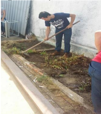
Figura 3 – Preparo da área de cultivo.