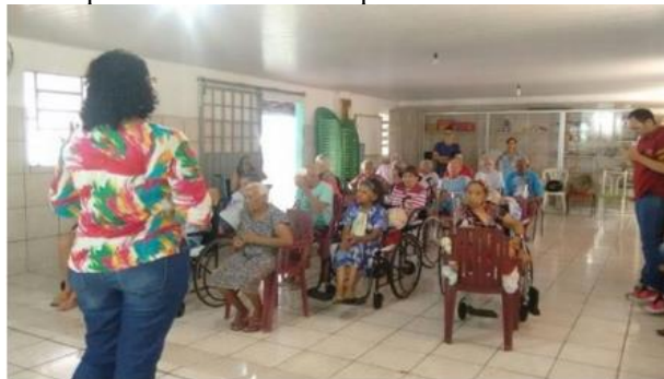
Figura 2 – Palestra ministrada pela bolsista sobre a importância dos alimentos.

Durante a apresentação houve interação com os idosos e todos mostraram-se bem entusiasmados e satisfeitos com as informações repassadas. Ao final da palestra, houve uma roda de conversas para que cada idoso contasse um pouco de sua vida e para cada um deles foram entregues brindes. De acordo com Pinto (2006), socializar é interiorizar os conceitos, valores, crenças de determinada cultura, é o indivíduo construir para si um mundo histórico, humano, circundado de significações. É a cultura em suas relações de