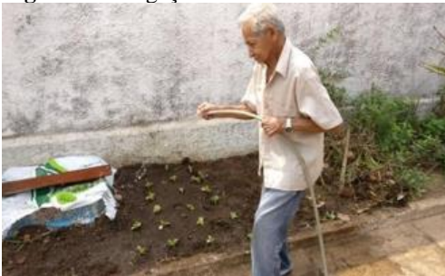
Figura 5 – Irrigação das mudas.