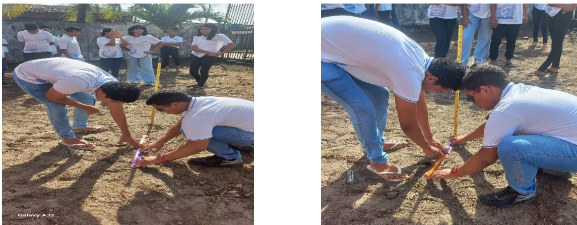
Figura 1. Medições realizadas pelos estudantes

Sobre a utilização de sites e simuladores para realizar os cálculos de distância entre coordenadas, encontrar localização e o azimute da Terra os alunos demonstraram facilidade para produzir, coletar e gerar informações. Sobre a realização dos cálculos para encontrar o ângulo projetado no cabo de vassoura, os alunos tiveram um pouco mais de dificuldade e para o avanço dos cálculos realizamos algumas demonstrações no quadro branco como vemos ilustrado na imagem da Figura 2.