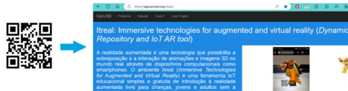
Figura 2 – QR code de acesso ao Itreal

de Souza e Jucá (colaboradora e idealizador do projeto, respectivamente, e dois dos autores desse estudo), desde sua criação (Março / 2023) até a atualidade, além de discutir as possibilidades futuras provenientes do uso do Itreal em um contexto educacional.