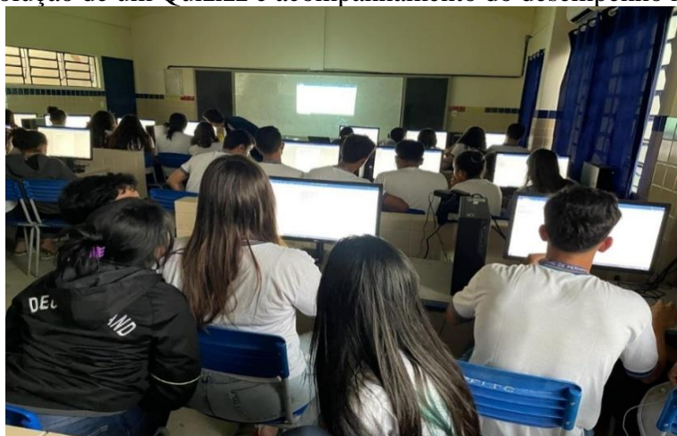
Figura 3: Resolução de um Quizizz e acompanhamento do desempenho no jogo.

O uso do Quizizz de fato chamou a atenção do educador envolvido, uma plataforma que disponibiliza inúmeras atividades prontas, permitido também que o educador possa elaborar sua própria competição a partir do nível e necessidade dos seus educandos. As atividades ofertadas por essa ferramenta podem ser trabalhadas diretamente em sala de aula, como também pode ser lançada como atividade de casa, sendo estabelecido um cronograma para realização.