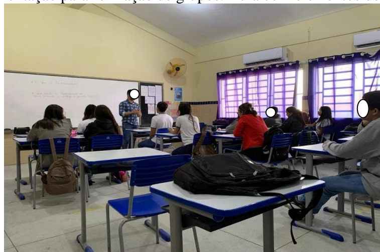
Figura 1: Orientação para formação de grupos: Aula com elementos de gamificação.

Seguindo os conteúdos previstos no currículo, e de acordo com as orientações feitas nas rodas de conversas, o educador de ciências da natureza implantaram atividades lúdicas e diferenciadas. Jogos interativos de caráter físico e eletrônico, permitindo interações diretas entre os educandos. O educador optou em trazer elementos de gamificação, organizando suas salas em grupos (Figura 1), e no decorrer da aula perguntas eram feitas. O grupo que respondesse corretamente acumulava pontuações, essas estratégias proporcionaram a criação de uma atmosfera interativa de caráter lúdico. Os educandos puderam promover interações competitivas e colaborativas (LIMA, 2017).