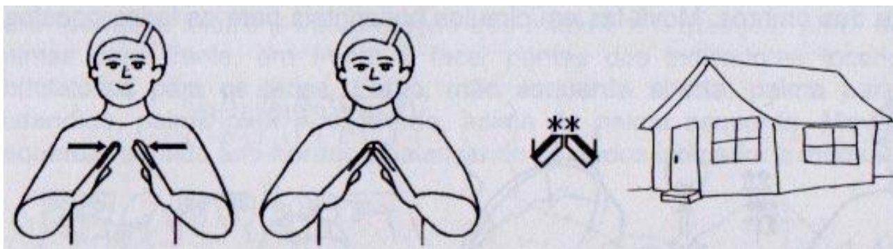
Figura 2 - Sinal de “casa”