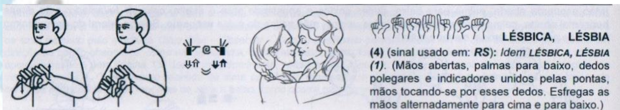
Figura 10 - sinal LÉSBICA (5)

Etimologia: o sinal apresenta a mesma configuração de mãos do sinal de VAGINA e o movimento de fricção entre as mãos, ou seja, este sinal apresenta a relação sexual entre mulheres cisgêneras.