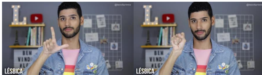
Figura 1 - sinal LÉSBICA (1)

Etimologia: o sinal é soletrado com as letras L e S em Libras inicializadas da palavra “lésbica” emprestada do português.