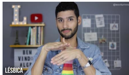
Figura 8 - sinal LÉSBICA (4)