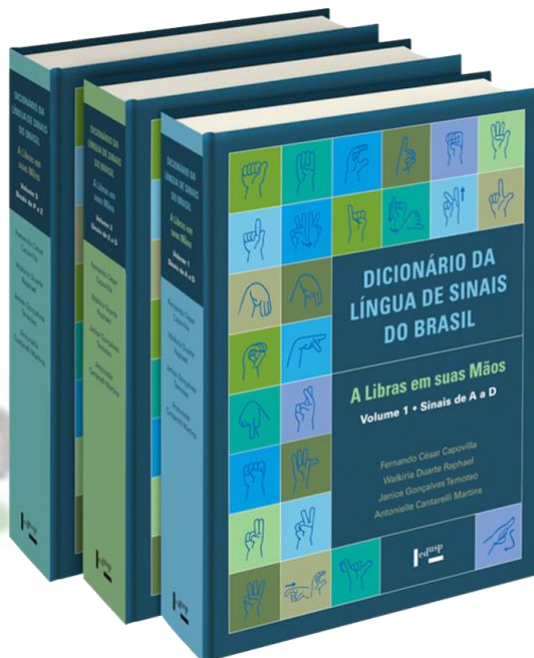
Figura 1 - Dicionário da Língua de Sinais do Brasil