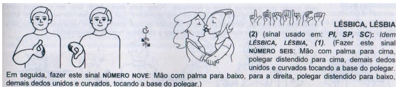
Figura 6 - sinal LÉSBICA (2)