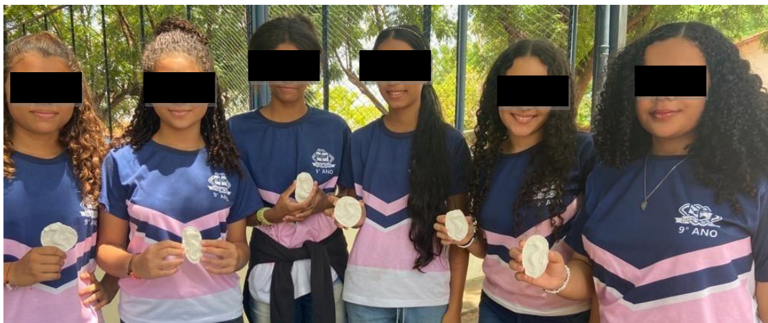
Figura 04. Exposição e apresentação dos fósseis criados pelos alunos.

Durante a exposição, observou-se um aumento significativo na participação dos alunos, sugerindo um maior engajamento com o conteúdo, pois os mesmos mostraram grande interesse em explicar o material didático de sua própria autoria. É importante ressaltar que houve controvérsias em relação ao modelo didático e objeto real. Por esse motivo, é essencial entender que os modelos são simplificações de um objeto real ou fases de um processo dinâmico. Dessa forma, para superar essas restrições e envolver os alunos no processo de aprendizado, é de suma importância que eles criem seus próprios modelos (MATOS et al., 2014).