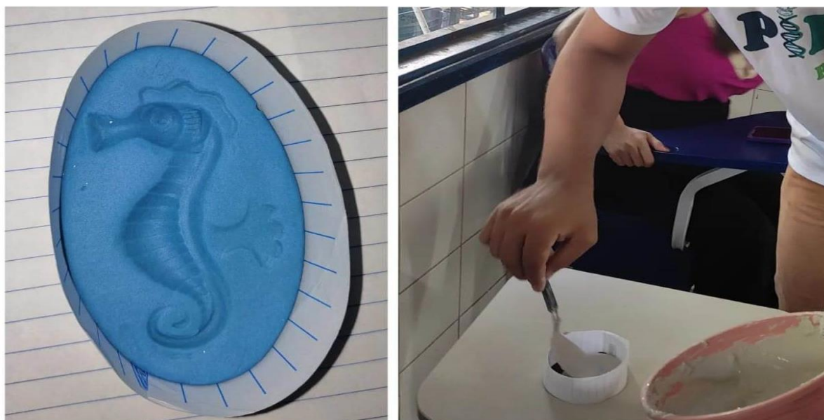
Figura 02. Molde do fóssil finalizado e aplicação do gesso.

Na etapa final da prática educativa, os alunos foram divididos em duplas onde cada uma delas ficou responsável pela produção do fóssil, onde os mesmos tiveram a oportunidade de vivenciar o processo de criação e análise de fósseis artificiais. Foi utilizado como materiais a massa de modelar, papel, gesso e animais em miniatura, onde cada dupla foi solicitada a cortar o papel em retângulos para as bordas e um quadrado para a base. Os pibidianos distribuíram massa de modelar para cada dupla junto com um animal em miniatura, de sua escolha. As duplas foram então orientadas a envolver bem a massa e deixá-la plana sobre a folha recortada. Eles então tiveram que pressionar os animais em miniatura sobre a massa para deixar marcas fisiológicas nos moldes, e então posteriormente foi misturado o pó de gesso com água e adicionado à mistura em cada molde como mostra a imagem a seguir: