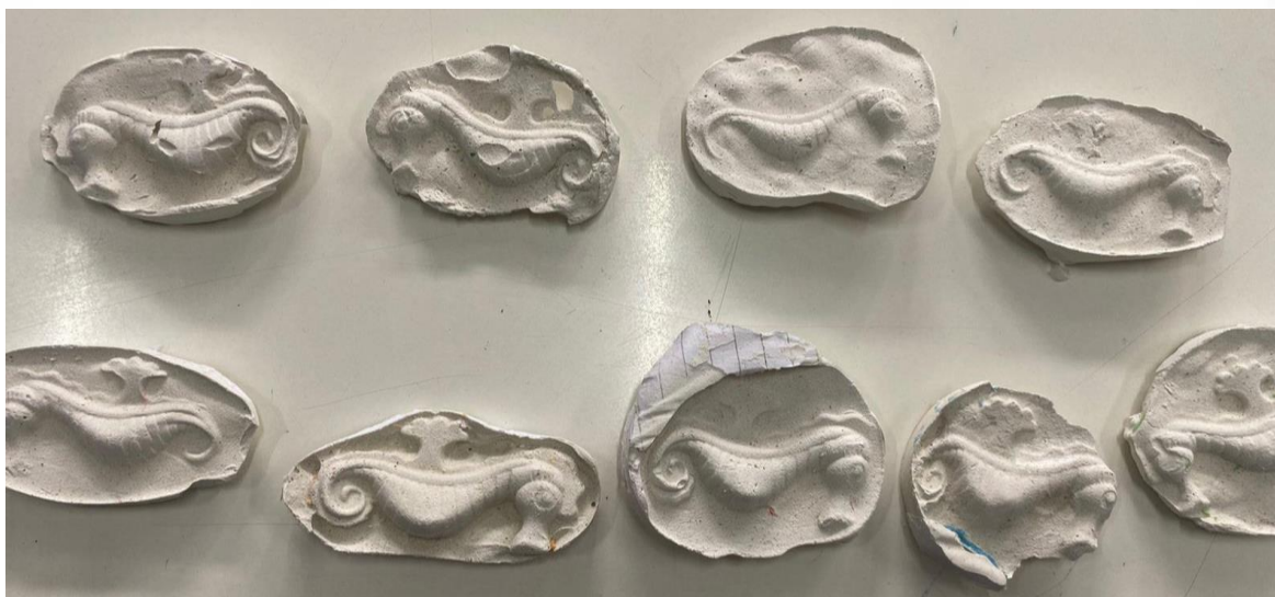
Figura 03. Modelo de fóssil em gesso finalizado.