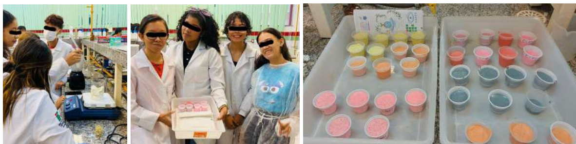
Figura 04 - Produção de sabonetes com base pronta.

coloridos (Figura 4). Os sabonetes com base glicerizada pronta foram entregues aos participantes no segundo dia da oficina.