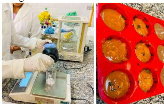
Figura 05 - Produção da base glicerizada.

No segundo dia, realizou-se a produção da base glicerizada (Figura 5), uma das práticas mais longas que demandam mais atenção, uma vez que os participantes utilizaram uma base forte de NaOH. Nessa prática, todos os bolsistas ficaram mais atentos para evitar acidentes. A base glicerizada produzida pelos participantes foi liberada após 30 dias. É comum na fabricação de sabão aguardar um tempo de "cura", visto que a reação de hidrólise alcalina continua ocorrendo durante este período, o que é um fator determinante para a obtenção do pH desejado com a efetivação quase que completa da reação (Ramos, 2017).