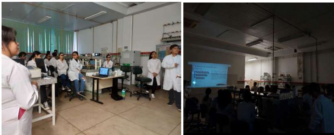
Figura 02 - Aula teórica realizada no 1º dia de oficina.

as explicações conceituais foram planejadas para serem conduzidas de forma leve, com bom humor, buscando uma linguagem acessível. Também foram realizadas as duas primeiras práticas, que demandam menos tempo.