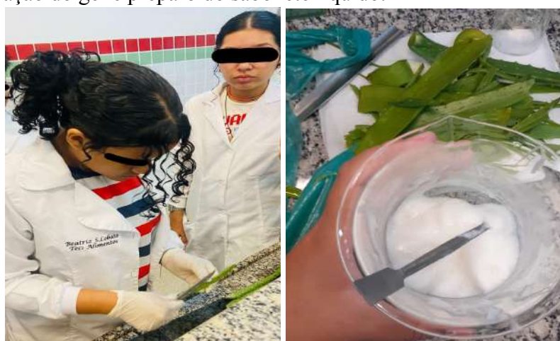
Figura 03 - Extração do gel e preparo do sabonete líquido.

Depois da parte teórica, os participantes foram divididos em 5 grupos, sendo cada grupo designado e orientado para a primeira etapa, que consistiu na preparação do sabonete líquido de babosa. Essa fase foi a mais prática, e percebeu-se a dificuldade dos alunos em relação à extração do gel de babosa (Figura 3).