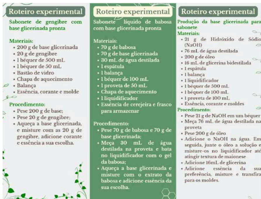
Figura 01 - Folder contendo o roteiro de prática.

Posteriormente, os participantes foram instruídos sobre os passos que seriam desenvolvidos durante a oficina, e o roteiro de cada prática foi devidamente organizado em um folder, conforme pode ser observado na Figura 5.