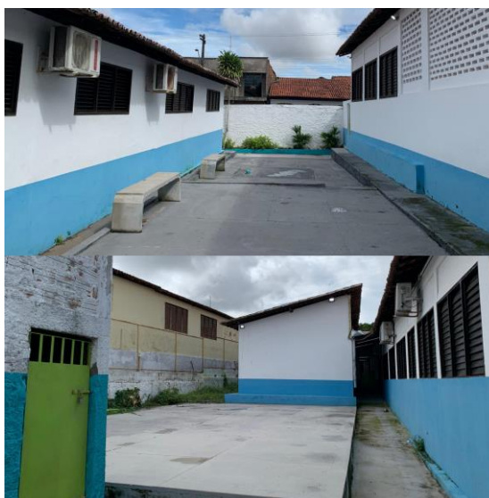
Imagem 1: Espaço para aulas práticas de Educação Física - escola 1

No que diz respeito aos espaços das aulas práticas, devido à ausência de uma quadra poliesportiva, são realizadas em locais inapropriados, sem cobertura, sinalizações e condições devidas para uma aula de Educação Física, como ilustrados na imagem 1.