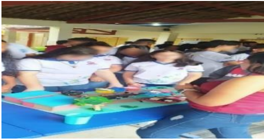
Figura 7: Exposição em Escola de Junqueiro-AL.