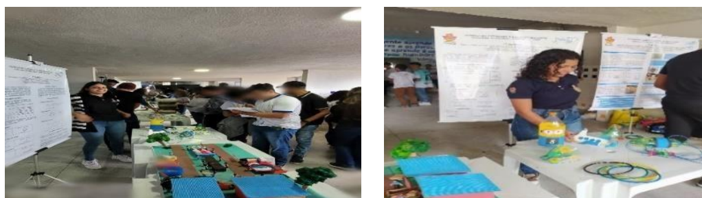
Figura 6: Exposição Escola Costa Rego, Arapiraca-AL.

A 3ª amostra do evento ocorreu na Escola Costa Rego situada na cidade de Arapiraca (figura 6), com a participação dos alunos do ensino médio e todo corpo docente no turno da manhã, onde mostrou que fazer o uso de recursos lúdicos no ensino de química para ampliar a absorção do conhecimento é uma prática eficaz na formação continuada docente.