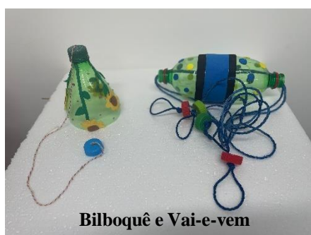
Figura 3: Brinquedos produzidos a partir de garrafas PETs.

Na confecção do jogo das argolas foi utilizado garrafas pet, fio de energia e durex colorido (figura 3), mediante deste brinquedo foi possível introduzir os tipos de plásticos utilizados na construção civil e aparelhos elétricos que foram o PVC (Policloreto de Vinila) e o PP (Polipropileno) e o PS (Poliestireno), no qual apresentamos que alguns plásticos de acordo com o seu processo de polimerização são produzidos como isolantes térmicos e isolantes elétricos como por exemplos os plásticos que é utilizado para encapar os fios elétricos. É importante ressaltar que brinquedos foram testados anteriormente para a realização das exposições.