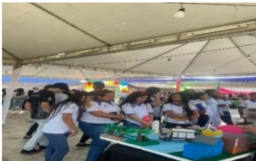
Figura 9: Exposição SNCT, UNEAL Campus I - Arapiraca-AL.

O projeto itinerante foi exposto na 20ª Semana Nacional de Ciência e Tecnologia (SNCT), ocorrida na Universidade Estadual de Alagoas (UNEAL) Campus 1 Arapiraca, onde os alunos de diversas escolas de Arapiraca, incluindo alunos da educação de jovens e adultos (EJA), puderam participar dos dois últimos dias de evento (figura 9). Como resultado ocorreu os saberes dos alunos incentivando o ensino e aprendizagem da química através da exposição dos processos químicos envolvidos na produção do plástico sintético e dos plásticos biodegradáveis.