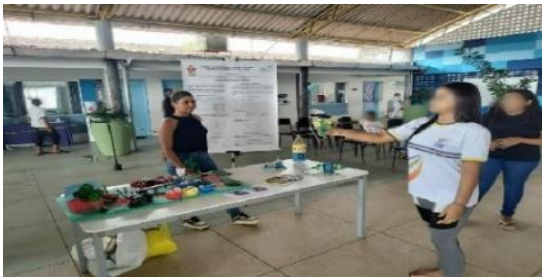
Figura 8: Exposição em Escola de Campo Alegre - AL.