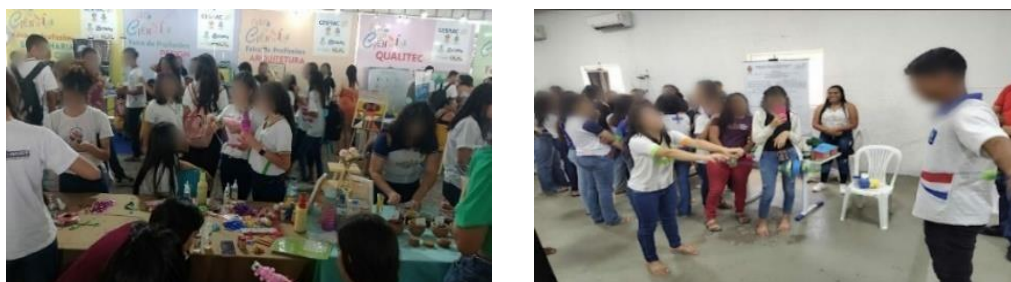
Figura 11: Exposição em escola de Major Isidoro/AL

E a 8ª e última exposição ocorreu na cidade de Major Isidoro, com a participação dos alunos de Ensino Médio (figura 11). Observou-se a importância da temática que foi considerada um tema atrativo pois estimulou o interesse dos alunos de acordo com seus comportamentos durante a exposição, fazendo diversas perguntas e até mesmo interagindo com o material produzido.