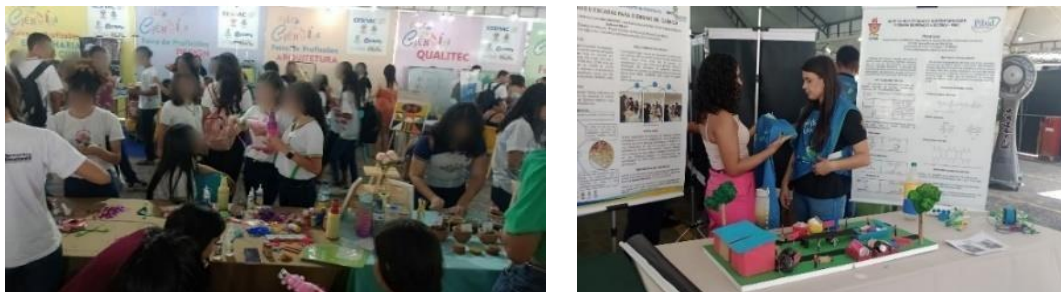
Figura 10: Exposição Feira de Ciências (FECIAL), Maceió- AL

do Estado de Alagoas. A Fecial é um projeto que tem se destacado por seu compromisso em fortalecer a educação nas escolas do Estado Alagoano (figura 10).