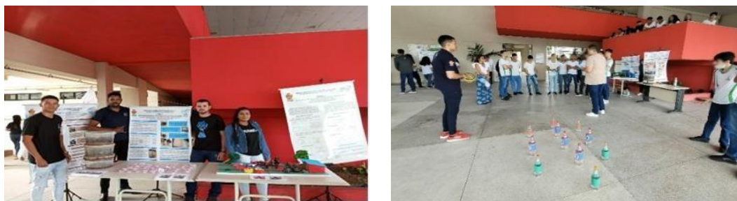
Figura 4: Exposição IFAL Campus Arapiraca/AL.