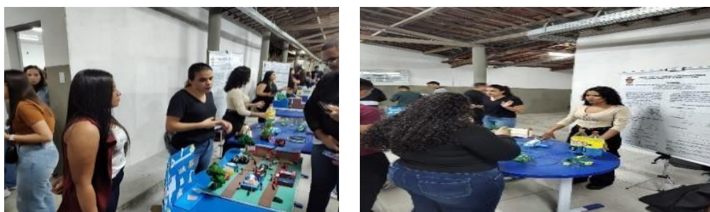
Figura 5: Exposição para calouros do curso de Química UNEAL Campus I Arapiraca-AL.