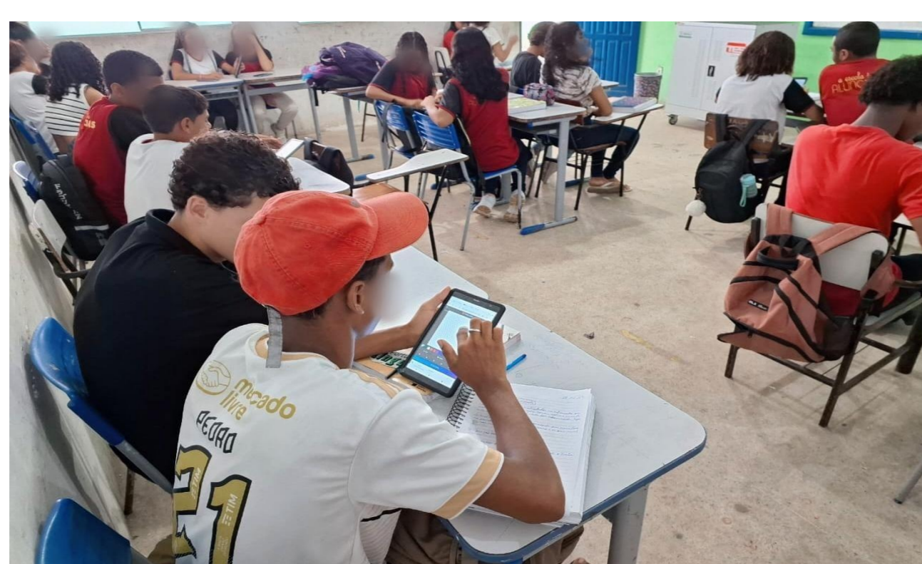
Figura 1– Aplicação da SD, na turma do 9º ano na escola campo

Com base nas informações e no conhecimento empírico adquirido durante a aplicação, é possível afirmar que trabalhar com o software Pixilart pode criar um espaço motivador e dinâmico, visto que permite que os discente façam experimentações e crie conjecturas a respeito do objeto estudado. Nesse processo ficou evidente a eficácia dessas metodologia, os alunos conseguiram realizar as tarefas, concluir o que foi proposto e chegar as conclusões esperadas. Todas as fases da SD, acarretaram conhecimento e experiência.