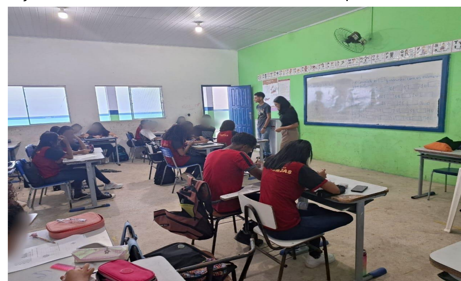
Figura 2- Aplicação da SD, na turma do 9º ano na escola campo

O presente trabalho foi realizado com o apoio da Coordenação de Aperfeiçoamento de Pessoal de Nível Superior - Brasil (CAPES), do Instituto Federal de Educação, Ciência e Tecnologia da Bahia (IFBA) - Campus Eunápolis, da Secretaria Municipal de Educação (SME). Agradecemos a todos pela oportunidade.