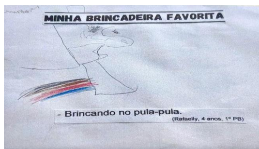
Figura 1 - Livro “Minha Brincadeira Favorita”

A experiência revelou que o ato de desenhar frequentemente antecedia a formulação oral mais organizada. Em uma das produções, ao representar a brincadeira de que mais gostava, uma criança inicialmente disse apenas o nome. Depois de olhar novamente para a folha e ouvir perguntas do grupo, acrescentou personagens, lugar, companhia e emoção associada à vivência. O registro gráfico operou, assim, como mediador da elaboração narrativa e não como simples ilustração posterior (Dias, 2021).