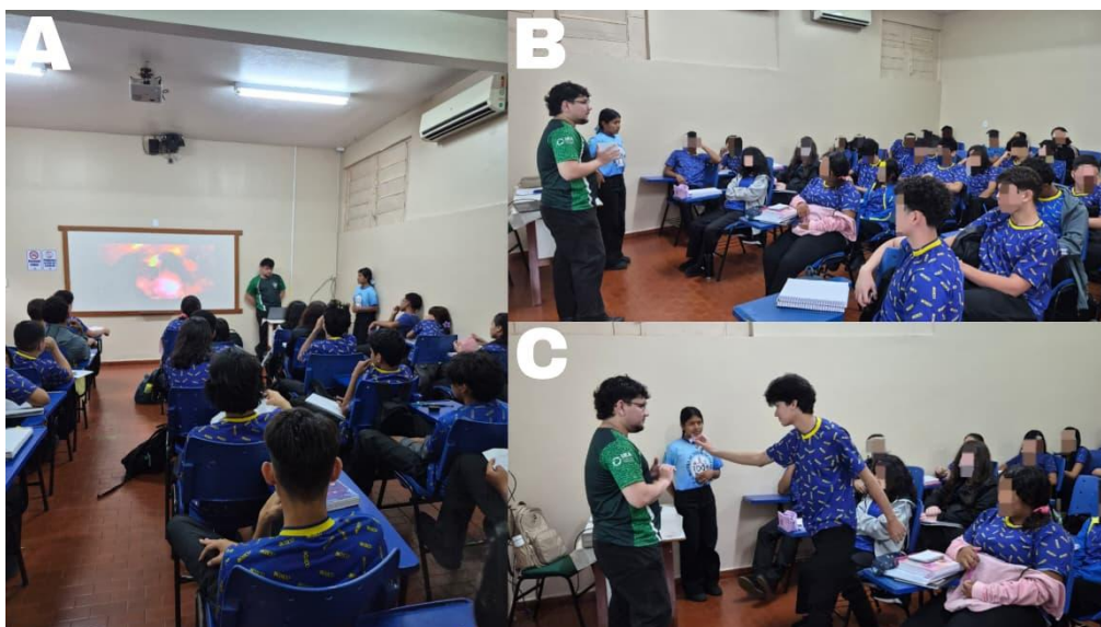
Figura 02. Registros da aula. A. Vídeo-aula sendo exibido sobre a Teoria de Oparin e Haldane. B. Professor introduzindo os estudantes na aula prática e C. A última plaquinha(coacervados) sendo adicionada pelo aluno.

Observou-se que os alunos conseguiram identificar corretamente os principais elementos presentes na atmosfera da Terra primitiva (Metano, Amônia, Hidrogênio e Vapor d'água), além de compreender a importância das fontes de energia (raios, vulcões e radiação solar) para desencadear reações químicas. A surpresa gerada pela simulação com a lanterna evidenciou o impacto positivo de recursos visuais e simbólicos no processo de aprendizagem, pois simulou as energias presentes na Terra primitiva destacando-se como um ponto alto da experiência. Além disso, a atividade favoreceu o desenvolvimento de habilidades como a colaboração, a comunicação e a interpretação científica, uma vez que os estudantes precisaram discutir, organizar e representar os fenômenos de forma conjunta.