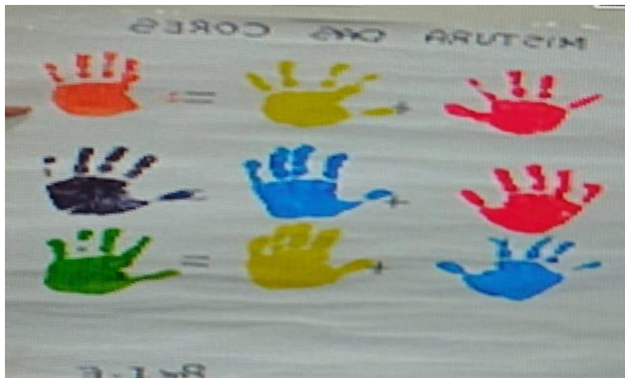
Figura 1 – Atividade pedagógica de exploração da mistura de cores realizada com alunos da Educação Infantil.

Essa compreensão dialoga com a perspectiva de que não há ensino sem uma dimensão ética e relacional, na qual o compromisso com o desenvolvimento do outro se expressa também na sensibilidade do educador. Nesse sentido, a prática observada aproxima-se de uma concepção de docência que valoriza a relação humana como fundamento do processo educativo.