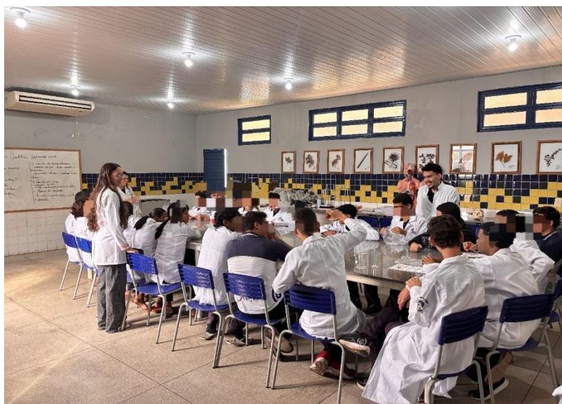
Figura 03. Estudantes realizando a prática