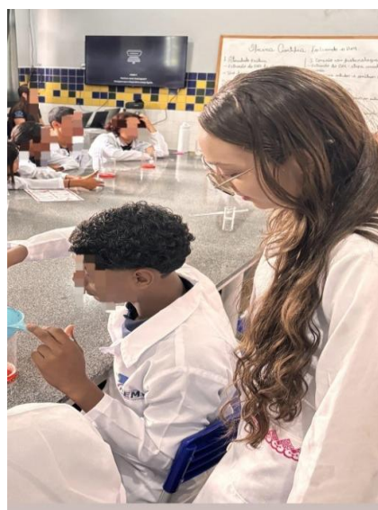
Figura 02. Orientando o estudante