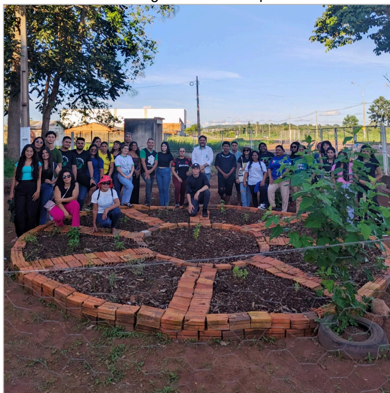
Figura 2: Momentos de troca de conhecimentos com os alunos do 2º período do Curso de Ciências Biológicas e também professores.

Além disso, a realização de atividades em grupo e a participação coletiva no cuidado do horto podem ser compreendidas a partir das contribuições, que enfatizam o papel das interações sociais no desenvolvimento moral e cognitivo. A vivência colaborativa proporcionou momentos de troca de conhecimentos, respeito às opiniões e construção conjunta de saberes ( figura 2).