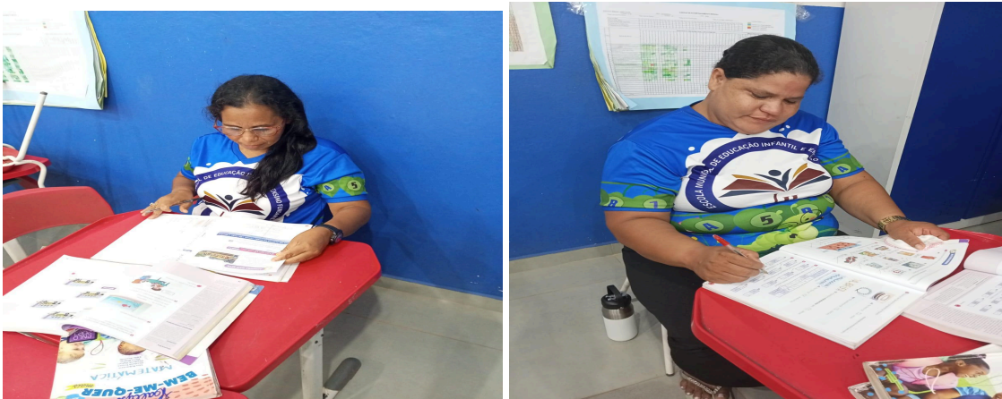
Figura 2: Utilização do livro didático

O PNLD (Programa Nacional do Livro Didático) garante que os materiais adotados passem por critérios rigorosos para auxiliar na alfabetização, tornando-os uma ferramenta chave na educação brasileira. A figura 2 e 3 mostram abaixo um instrumento indispensável para alfabetização e letramento que são os livros didáticos.