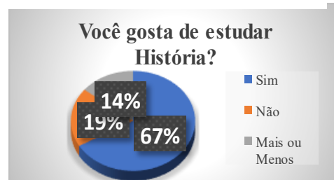
Gráfico 2: Dados extraídos do 6º ano C.