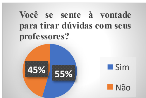
Gráfico 3: Dados extraídos do 8º ano A.

Abaixo, o gráfico sinaliza a porcentagem dos alunos que se sentem à vontade em tirar dúvidas com os professores.