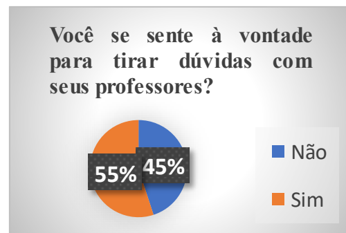
Gráfico 4: Dados extraídos do 6º ano A.