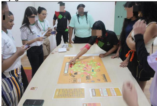
Figura 03. Aplicação do jogo de tabuleiro no DLI