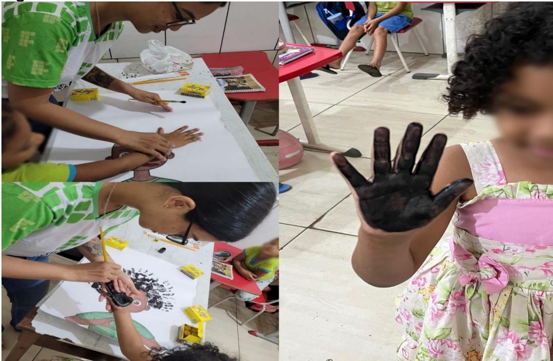
Figura 02. Atividade sobre as diferentes texturas de cabelos.