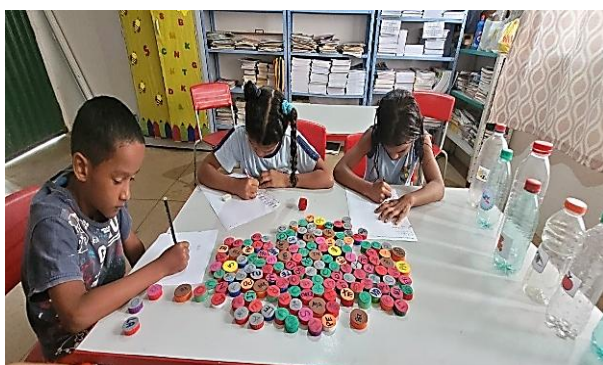
Figura 01. Formação de palavras.

Na Figura 01, observa-se que um dos alunos organiza inicialmente as sílabas de forma aleatória, evidenciando uma hipótese ainda não consolidada sobre a estrutura das palavras. Esse comportamento reforça a perspectiva de Teberosky (2003), ao afirmar que a aprendizagem da escrita ocorre por meio de construções progressivas, nas quais a criança formula e reformula hipóteses sobre o sistema de escrita. Já na Figura 02, durante a manipulação dos materiais, percebe-se maior atenção e tentativa de associação entre sons e letras, indicando avanço no processo de construção da escrita.