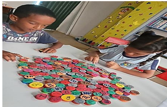
Figura 02. Manipulando os materiais.