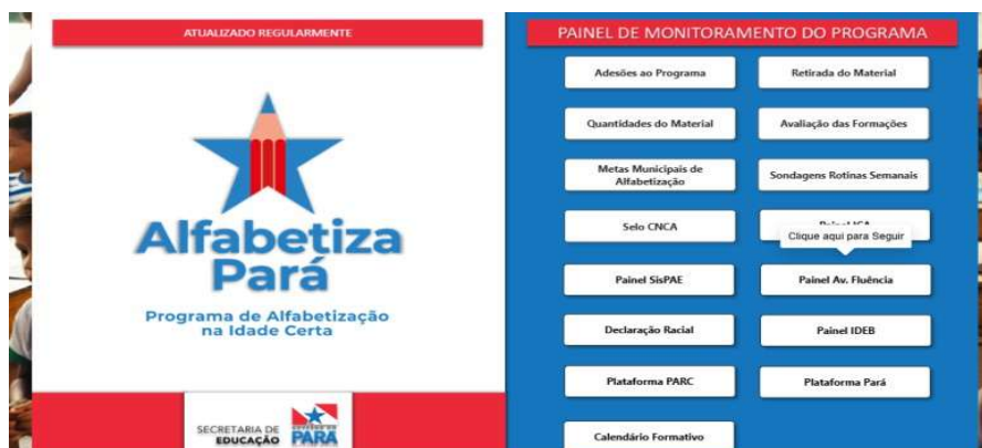
Figura 1. Painel de Monitoramento do Programa Alfabetiza Pará