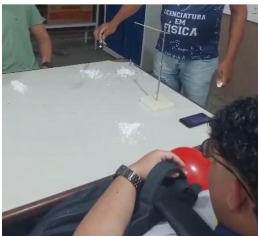
Figura 5. Demonstração do fenômeno de atração eletrostática.