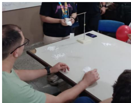
Figura 8. Aluna participando ativamente da manipulação do experimento.