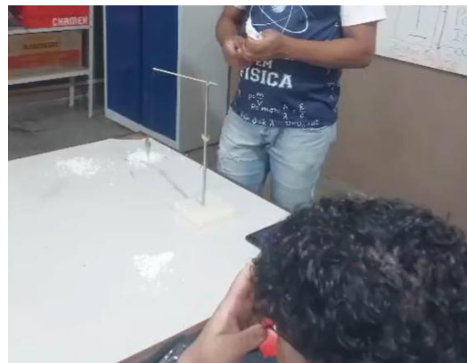
Figura 4. Interação do pêndulo com placa de alumínio para demonstrar polarização.