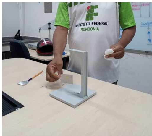
Figura 1. Teste e calibração do protótipo no laboratório de Física do IFRO.

2- Desenvolvimento e Calibração: O protótipo do pêndulo eletrostático foi construído com materiais acessíveis e testado previamente nos laboratórios do IFRO – Campus Porto Velho Calama, visando assegurar a eficácia das demonstrações de fenômenos como eletrização por atrito e contato (Figuras 1 e 2).