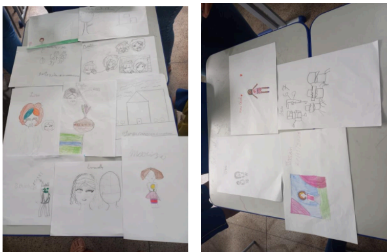
Figura 02: Expressões artísticas baseado no Livro “Bora lá curiá!” (Marques, 2024)

Os alunos representaram, em suas produções, elementos relacionados à diversidade, às brincadeiras e às características das personagens, o que indica a assimilação dos conteúdos trabalhados. A exposição dos trabalhos contribuiu para a valorização das produções e fortalecimento da autoestima dos estudantes, uma vez que “a afetividade desempenha papel fundamental no desenvolvimento da criança” (Wallon, 2007, p. 122).