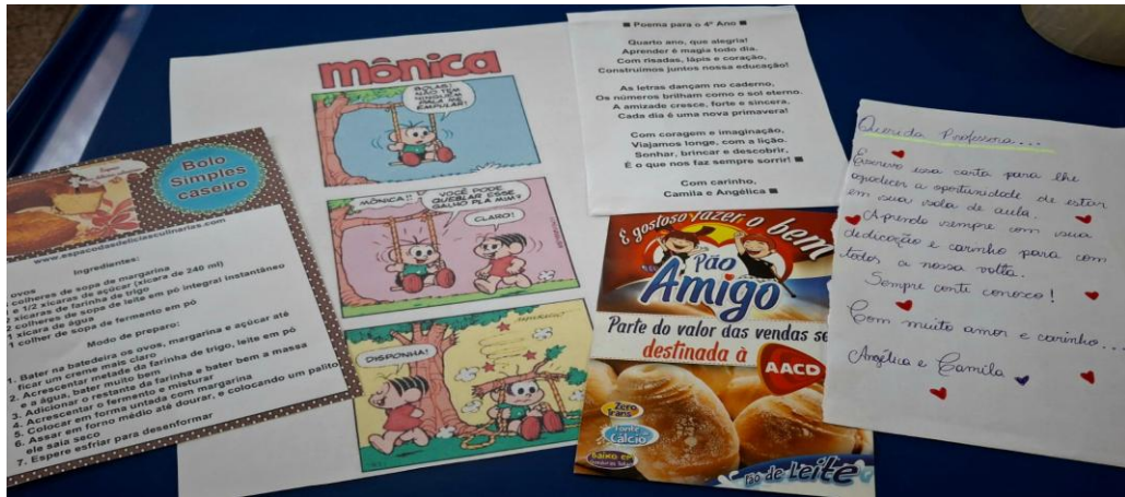
Figura 3. Diferentes gêneros trabalhados

Esse processo contribuiu para ampliar a compreensão sobre a diversidade de gêneros presentes no cotidiano, favorecendo o desenvolvimento da leitura e da escrita de forma contextualizada.