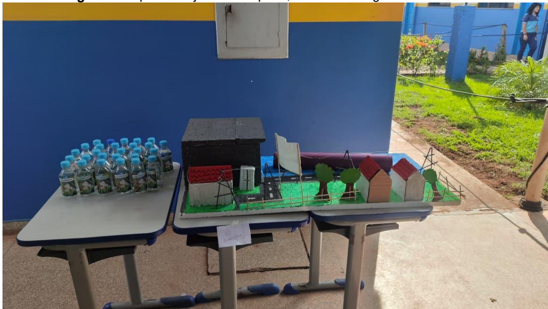
Figura 01. Apresentação de maquete, fonte de energia não renováveis.