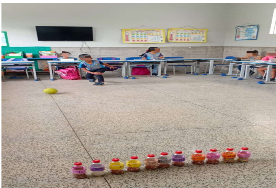
Figura 01: Crianças do 1º Ano realizando atividade lúdica em sala de aula – Jogo do Boliche.