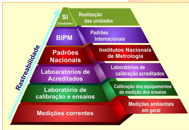
Figura 1. Estabelecimento da cadeia de rastreabilidade para as medições ambientais

A rastreabilidade metrológica, figura 1, é definida como a propriedade dum resultado de medição pela qual tal resultado pode ser relacionado a uma referência através duma cadeia ininterrupta e documentada de calibrações, cada uma contribuindo para a incerteza de medição (VIM, 2012).