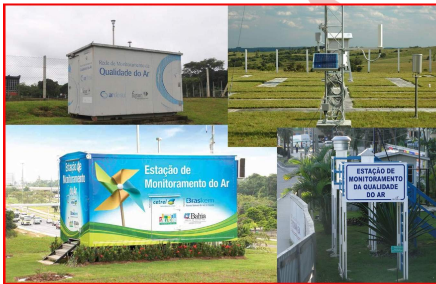
Figura 2. Estações de monitoramento do ar espalhadas pelo país

asseguradas e evidenciadas por sua rastreabilidade aos padrões de medição ou a materiais de referência certificados dos laboratórios acreditados e estes, em nível nacional, devem estar rastreados aos padrões de medição do Inmetro, estabelecendo a cadeia de rastreabilidade, onde, nacionalmente, no topo estão os padrões de medição do Inmetro.