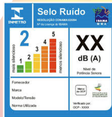
Figura 4. Selo criado pelo Inmetro e o Ibama para combater a poluição sonora no país.

eletrodomésticos mais silenciosos, estimular os fabricantes a produzirem produtos com níveis de ruídos cada vez menores e melhorar a saúde do cidadão. Recentemente, maio de 2016, a Comissão de Meio Ambiente e Desenvolvimento Sustentável da Câmara dos Deputados aprovou proposta que inclui a poluição sonora na lista de crimes ambientais, sujeitando o infrator à pena de detenção de seis meses a um ano e multa. 3) A atmosfera, que tem grande influência no clima da Terra, protegendo o planeta das radiações solares e desempenhando um importante papel no controle da temperatura do nosso meio ambiente. Desse modo, é importante monitorar os gases do efeito estufa; as emissões veiculares e industriais e a camada de ozônio.