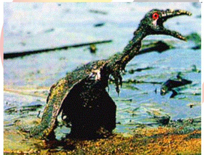
Figura 4 – Impactos causados pela poluição do óleo.

Portanto a poluição no mar pode atingir de uma forma drástica e rapidamente o ambiente marinho e os seres que o habitam, trazendo assim a morte instantânea do plâncton, ou ainda pela bio-acumulação, que é o fenômeno através do qual os organismos vivos acabam retendo dentro de si algumas substâncias tóxicas que vão se acumulando também nos demais seres da cadeia alimentar até chegar ao homem, sendo um processo lento de intoxicação e muitas vezes letal (GEO BRASIL, 2002). A poluição por óleo pode ser catastrófica.