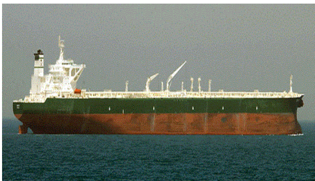
Figura1 – Navio Petroleiro.

Com o de objetivo explorar as ações dos navios que transportam petróleo pelos oceanos, dá-se a continuidade a nossa pesquisa. Dedicaremos ao estudo, à discussão de alguns aspectos ligados aos danos ambientais provocados por este tipo de poluição.