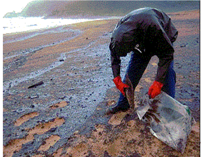
FIGURA 5 – Praias impróprias para o banho.

tornando-as impróprias para o banho. Muitos meios já foram e ainda estão sendo desenvolvidos para recolher o óleo que por vezes se derrama no mar.