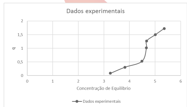
Figura 2: isoterma de adsorção.

A partir dos resultados obtidos tentou-se formar uma isoterma fazendo o gráfico da concentração de equilíbrio pela massa de óleo adsorvido por grama de adsorvente ( C_{eq} \times q ).