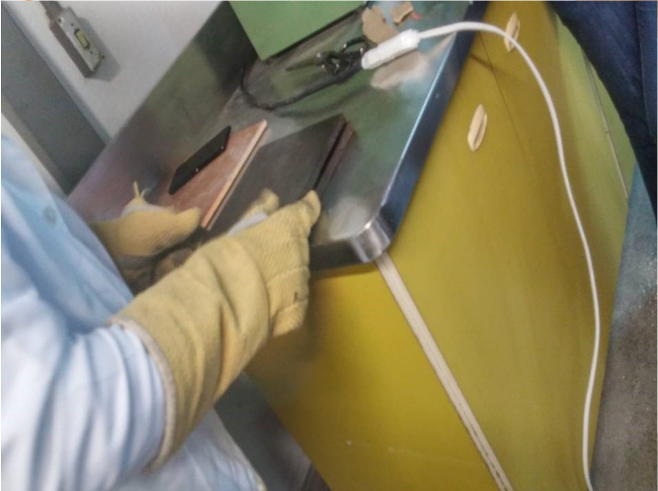
Fig. 6 Retirando material vulcanizado da Prensa Hidráulica

II CONGRESSO NACIONAL DE ENGENHARIA DE PETRÓLEO, GÁS NATURAL E BIOCOMBUSTÍVEIS IV WORKSHOP DE ENGENHARIA DE PETRÓLEO