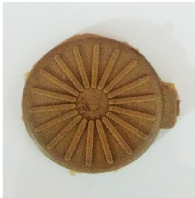
Fig. 8 Durômetro Shore A e Corpo de prova para aferir dureza