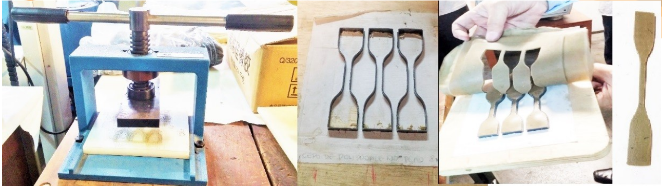
Fig. 7 Balancim, molde para corte de corpos de prova de 8 mm adequados para os ensaios do trabalho e, no extremo direito um corpo de prova.

II CONGRESSO NACIONAL DE ENGENHARIA DE PETRÓLEO, GÁS NATURAL E BIOCOMBUSTÍVEIS IV WORKSHOP DE ENGENHARIA DE PETRÓLEO