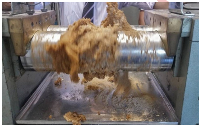
Figura 2. Elastômero com argila e oligômero no misturador de rolos.

Foram pesados 40 g de argila juntamente com 4 g do oligômero (carga) (Tabela 1) e essa mistura foi adicionada a massa no misturador (Fig. 3).