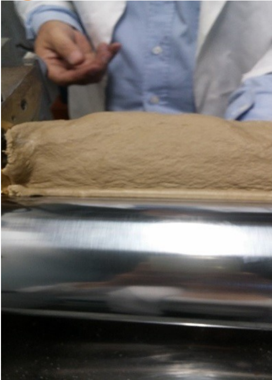
Fig. 4 Massa homogeneizada e composição completa

II CONGRESSO NACIONAL DE ENGENHARIA DE PETRÓLEO, GÁS NATURAL E BIOCOMBUSTÍVEIS IV WORKSHOP DE ENGENHARIA DE PETRÓLEO