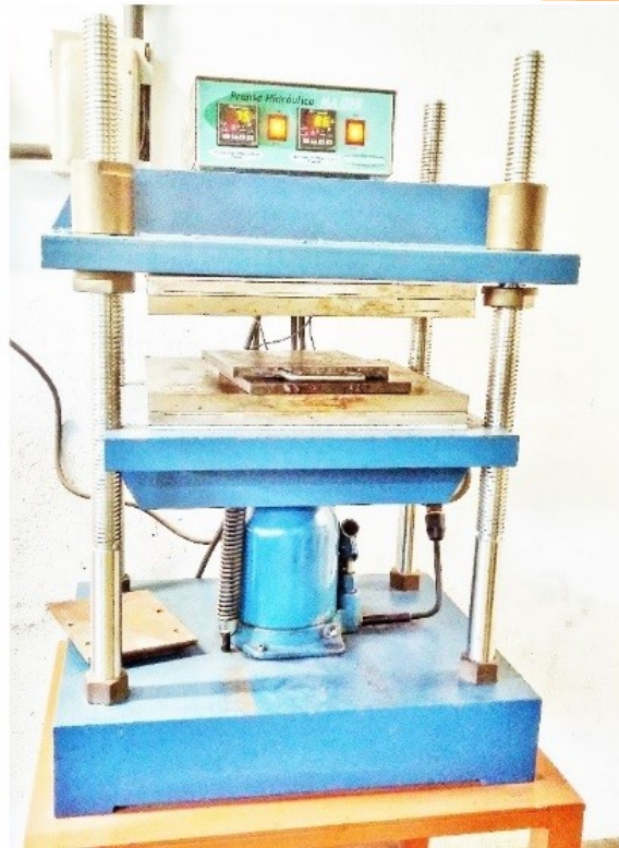
Fig. 5 Vulcanização

A mistura assim composta, foi submetida ao misturador de rolos e processada da mesma maneira, mas, quando a massa obtida apresentou aspecto totalmente homogêneo foi retirada do misturador (Fig. 4) e colocada na Prensa Hidráulica para o processo de vulcanização.