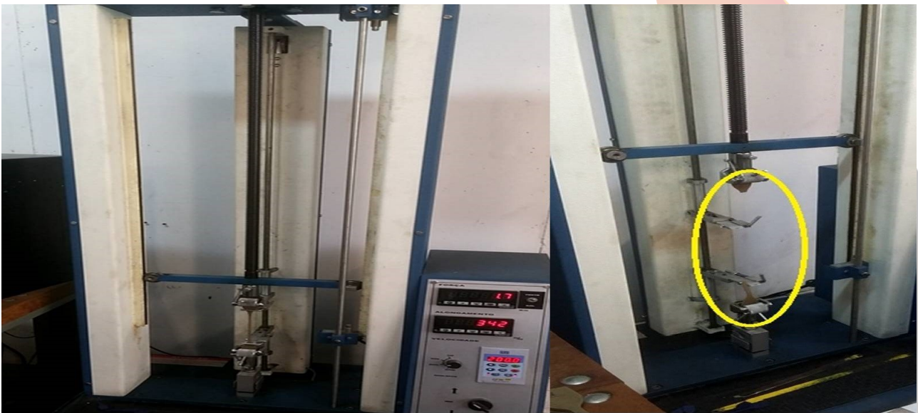
Fig. 9 Máquina Universal e Corpo de prova fixado às garras (a) e Ruptura do corpo de prova (b).

Também foram calculadas as médias das aferições resultantes dos ensaios, para se obter resultados que se apresentam na seção correspondente.