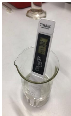
Figura 2 – Teste de condutividade do AEHC.