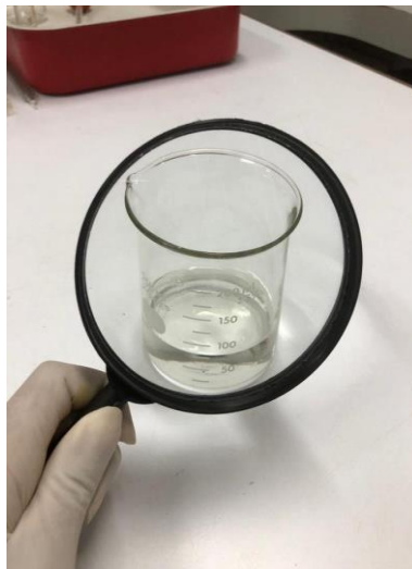
Figura 1 – Aspecto visual e coloração para o AEHC.

Para realizar esse teste, foi utilizado um béquer de 500 mL, em que se verteu a amostra de etanol contida no frasco âmbar (de coloração marrom), e com isso, foi avaliado a cor, aspecto de limpidez e a presença de sólidos em suspensão. Na Figura 1 é observado uma amostra límpida e incolor.