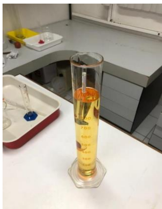
Figura 5 – Amostra com densímetro imerso para verificação da massa específica.