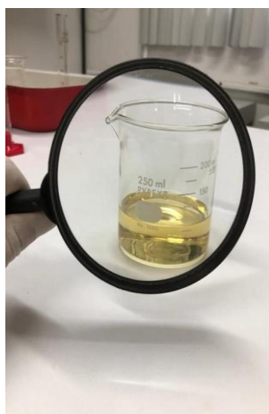
Figura 4 – Aspecto visual e coloração para gasolina tipo C.

Para realizar esse teste, foi utilizado um béquer de 500 mL, em que verteu-se a amostra de gasolina contida no frasco âmbar (de coloração marrom), e com isso, foi avaliado o aspecto de limpidez e a presença de sólidos em suspensão. Na Figura 4 é apresentado uma amostra de gasolina tipo C durante a realização da inspeção visual.