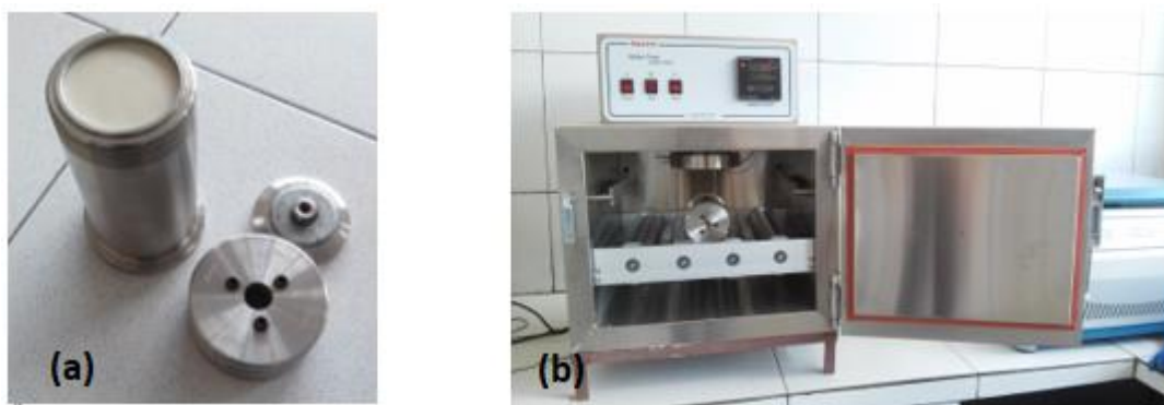
Figura 1 – (a) Célula de envelhecimento, (b) Equipamento Fann Estufa Rotativa Roller Oven.

Após a preparação do fluido de perfuração e determinação dos parâmetros químicos, o fluido foi transferido para uma célula de pressão de aço inoxidável com capacidade para 260 mL ilustrada na Figura 1 (a), a qual foi colocada no equipamento Fann Estufa Rotativa Roller Oven, o qual simula o efeito do envelhecimento do fluido de perfuração enquanto este circula no poço, como ilustrada na Figura 1 (b), onde permaneceu por um tempo de 6 horas nas temperaturas determinadas para cada experimento.